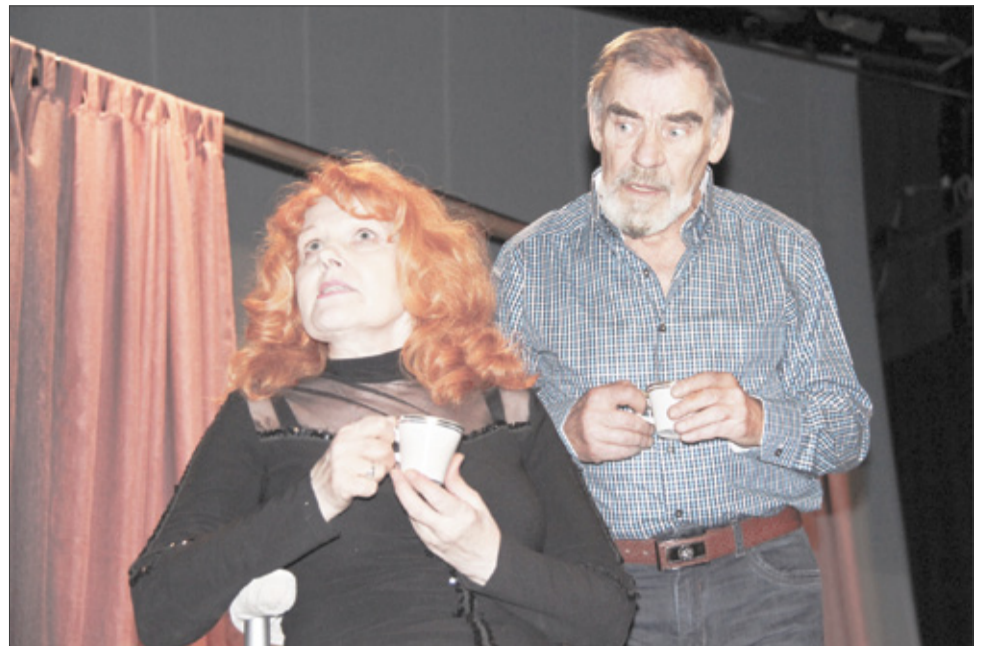
Сцена из спектакля «Тустеп на фоне чемоданов»

«Тустеп на фоне чемоданов» – лирическая комедия в двух действиях, герои которой – мужчина и женщина, потерявшие свои «вторые половинки», ведут диалоги